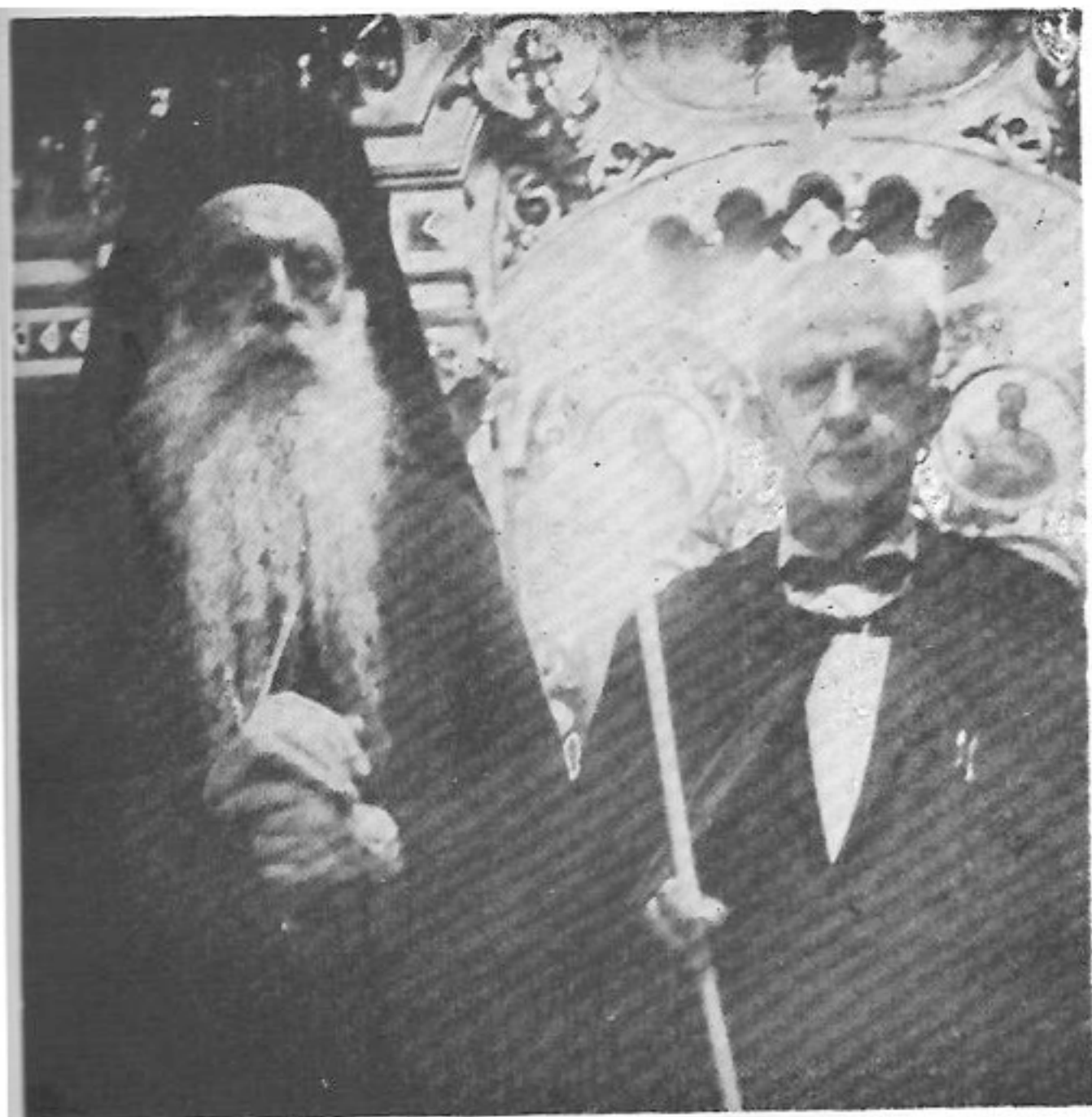
Ὁ ἀείμνηστος Πατριάρχης τοῦ Γένους Ἀθηναγόρας κατὰ τὴν τελετὴν τῆς ἀπονομῆς τοῦ τίτλου τοῦ Μεγάλου Ρεφερενταρίου στὸν συγγραφέα Γιατρό. Σ' αὐτὸ προστέθηκε ἀργότερα καὶ ὁ τίτλος τοῦ Ἱππότη τοῦ Ἁγίου Ἀνδρέου ἀπὸ τὸν Παναγιώτατον Πατριάρχην Δημήτριον.